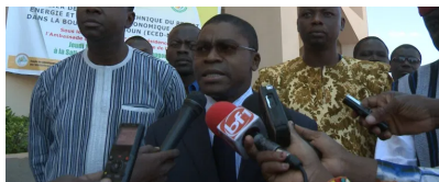
L'ambassadeur du Canada au Burkina Edmond D. WEGA: Le projet va en droite ligne avec la politique de l'aide féministe du gouvernement canadien.