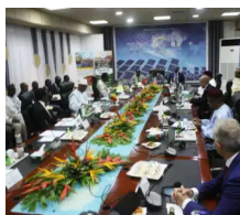
Burkina Faso:Initiative « Desert to Power » : Un palliatif au déficit énergétique dans la Zone du Sahel