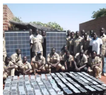
Burkina Faso : Dédougou , CB énergie pour réduire le déficit énergétique et contribuer à la protection de l'environnement